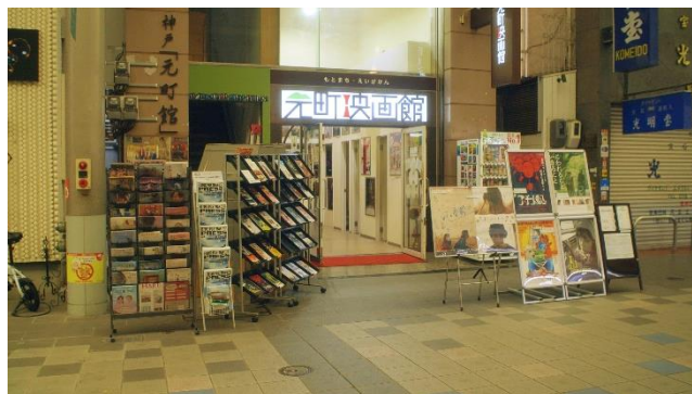
元町映画館（兵庫県神戸市）