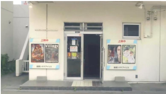
函館市民映画館シネマアイリス（北海道函館市）