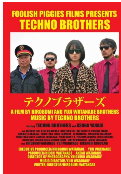
【Mark Schilling 氏推薦】 『テクノブラザーズ』(2023年) 監督：渡辺紘文