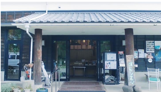
深谷シネマ（埼玉県深谷市）