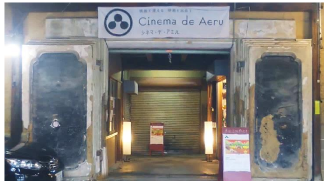
シネマ・デ・アエル（岩手県宮古市）