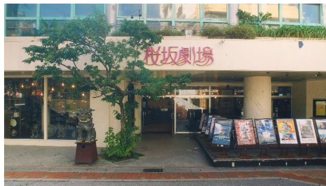
桜坂劇場（沖縄県那覇市）