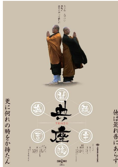
【jig theater 推薦】 『典座 -TENZO-』(2019年) 監督：富田克也