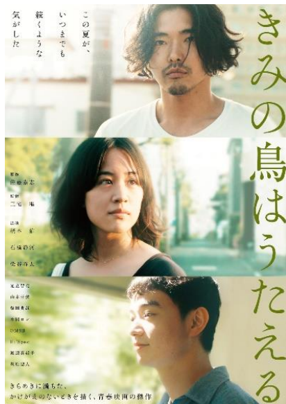
[函館市民映画館シネマアイリス推薦] 『きみの鳥はうたえる』(2018年) 監督：三宅唱