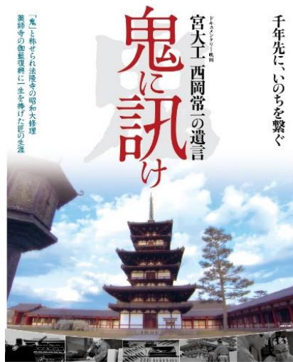
『鬼と称せられた法隆寺の昭和火修理 薬師寺の伽藍復興に一生をかけた匠の生き』 千年先にいのちを繋ぐ 宮大工 西岡常一の遺言 山崎佑次監督作品 ナレーター 石橋蓮司 ©『鬼に訊け』製作委員会 [深谷シネマ推薦] 『鬼に訊け 宮大工 西岡常一の遺言』(2012年) 監督：山崎佑次