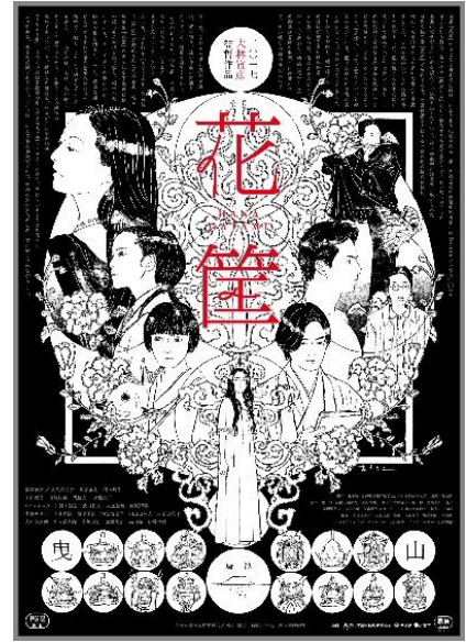
【THEATER ENYA 推薦】 『花筐/HANAGATAMI』(2017年) 監督：大林宣彦