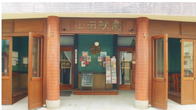
上田映劇（長野県上田市）