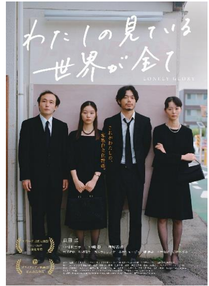
©2022 Tokyo New Cinema [シネコヤ推薦] 『わたしの見ている世界が全て』 (2022年) 監督：左近圭太郎