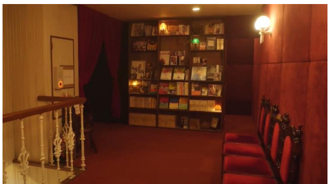
シネコヤ（神奈川県藤沢市）